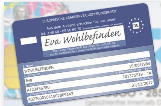
EHIC – European Health Insurance Card